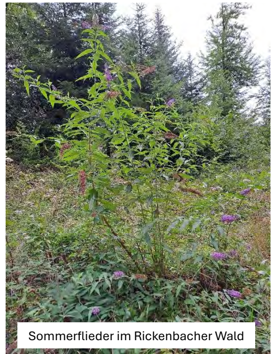
Sommerflieder im Rickenbacher Wald

Helfen Sie bitte mit, die Vermehrung des invasiven Sommerflieders aktiv zu verhindern und schneiden Sie Ihren Strauch frühzeitig - oder noch besser - ersetzen Sie ihn durch eine nicht-invasive Art.